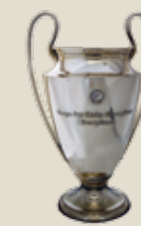
Europa Cup I (Champions League):